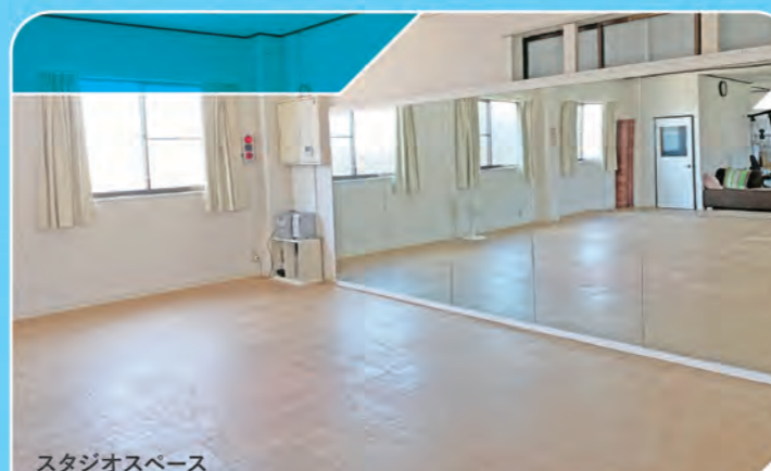
スタジオスペース