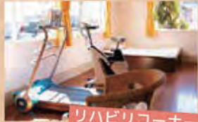
リハビリコーナー

個々の状態に合わせてリハビリのメニューを組みます。色々な機器を使ってトレーニングが出来ます。